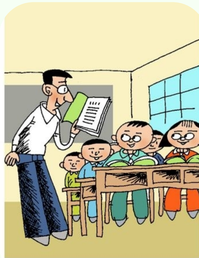
你靠什么来管理班级和学生