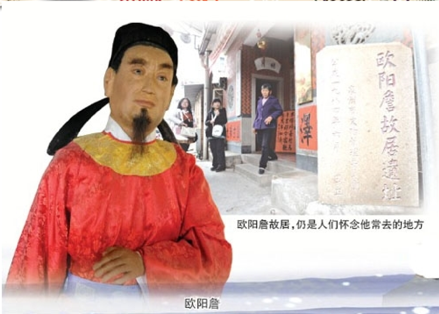
欧阳詹故居，仍是人们怀念他常去的地方