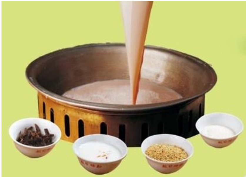
奶茶 Milk tea