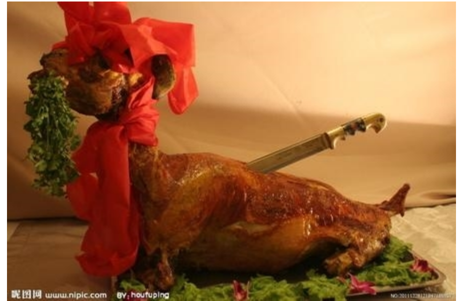
烤全羊 (Roast Whole Lamb)