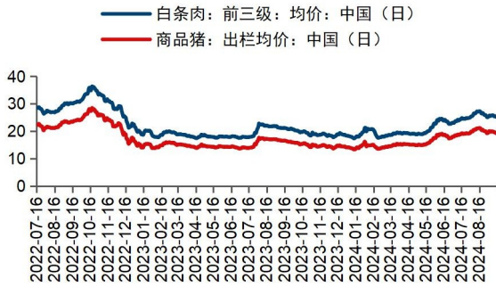
图1：本周商品猪出栏均价环比下跌（元/千克）