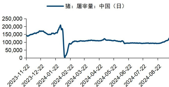
图5：本周屠宰场屠宰量环比增加（头）