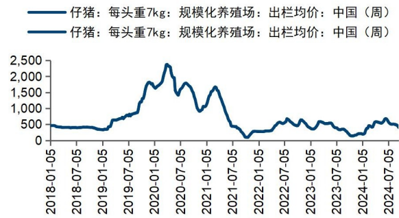
图2：本周断奶仔猪价格环比下跌（元/千克）