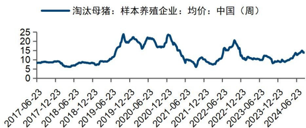
图6：淘汰母猪价格近期偏强（元/kg）