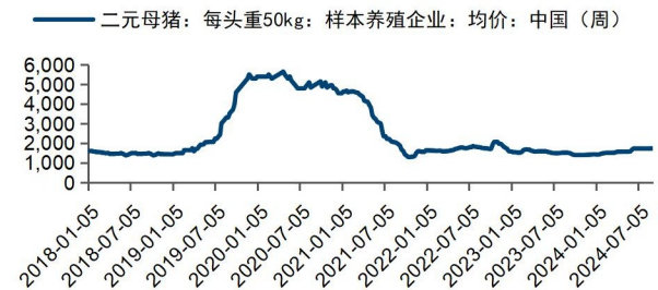
图4：50kg二元后备母猪价格窄幅波动（元/头）