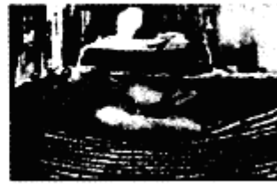
上海洪盛机器碾米厂