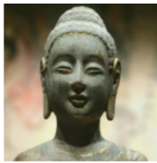
青州龙兴寺佛造像 【青州博物馆】