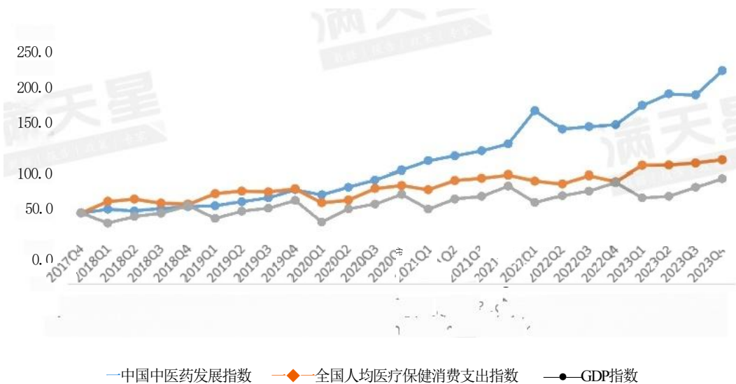
350. 图 1 中国中医药发展指数、全国人均医疗保健消费支出指数及GDP 指数对比图