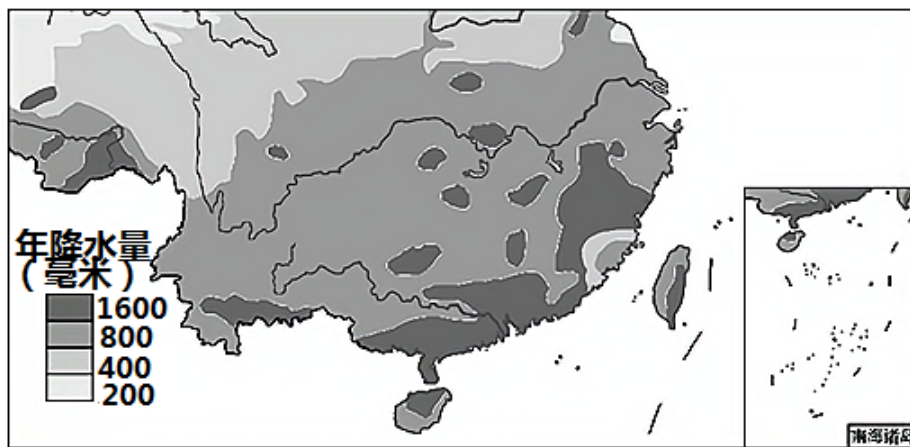
我国部分地区某年降水量分布示意图