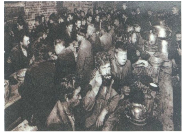
穷人在施粥棚内勉强果腹