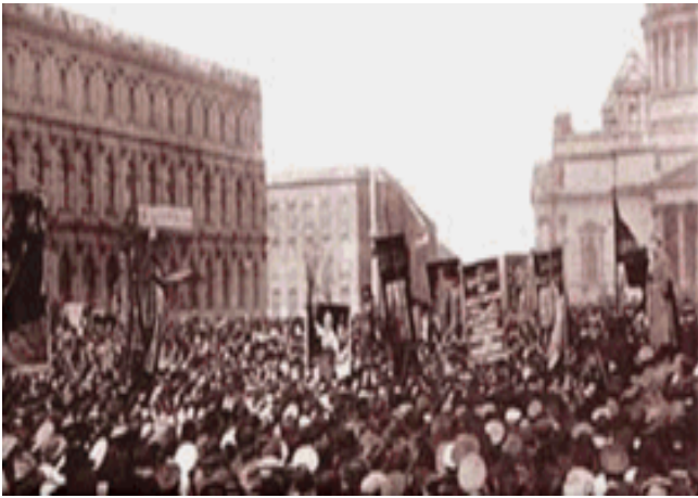
一战中俄国群众游行示威

材料三 1914年-1917年，俄国有1500多万人应征入伍，大量的未成年人和妇女被赶进了工厂，每天工作10小时以上。一战期间，俄国有150多万人死于战争，400多万人伤残，国内经济凋敝，民不聊生，农民反抗和工人罢工不断，国内社会矛盾不断激化。