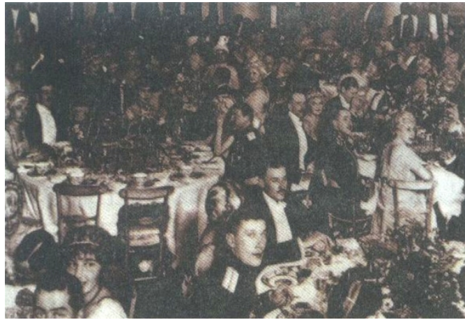
上流社会举行豪华酒宴