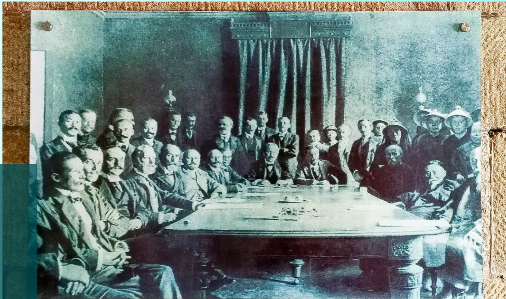
1901年签订《辛丑条约》，其中规定拆除沿海炮台，东炮台之炮机也被拆除。