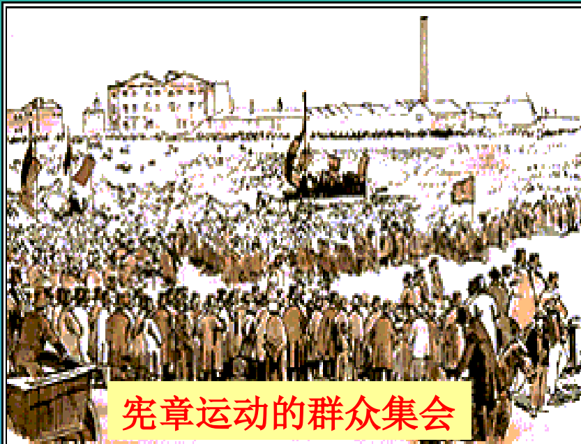
宪章运动的群众集会