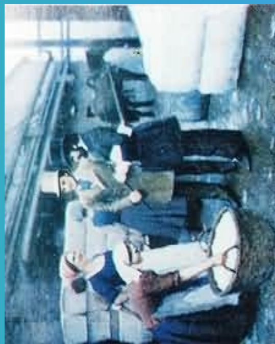
恩格斯在英国曼彻斯特走访工人区的情景