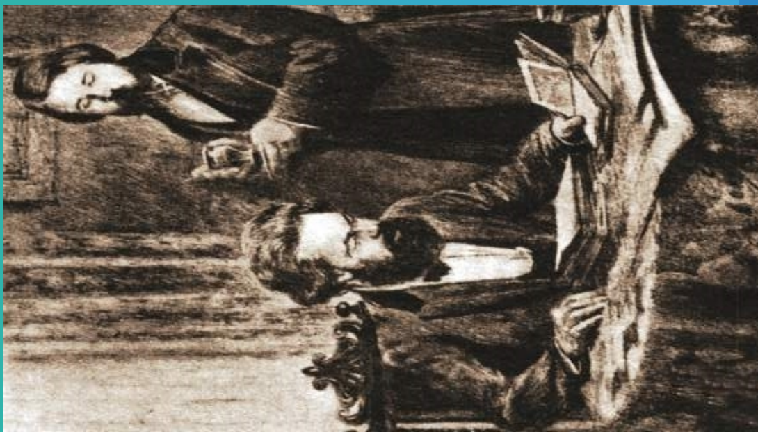
马克思和恩格斯在一起工作