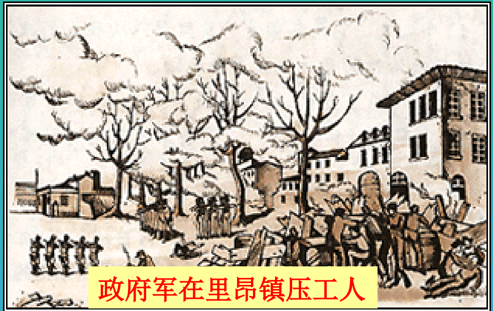
政府军在里昂镇压工人