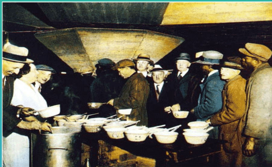
施粥棚里的失业者