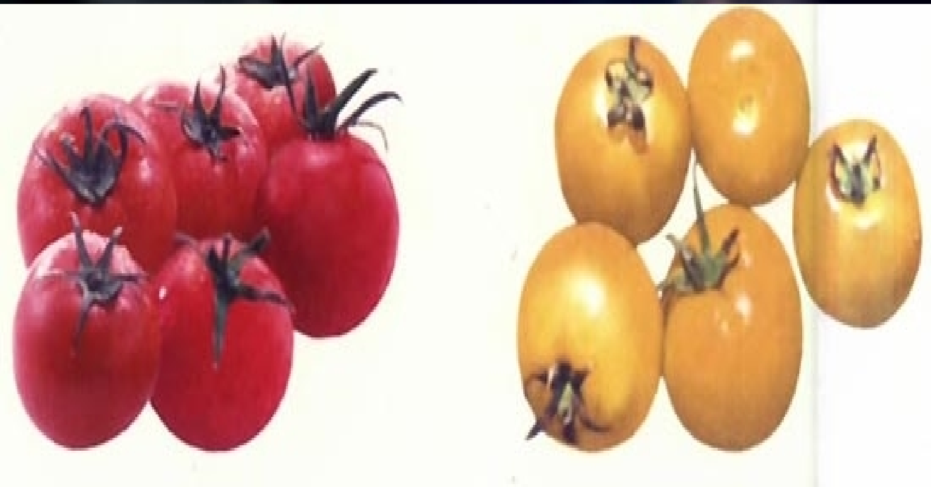
番茄的红果与黄果