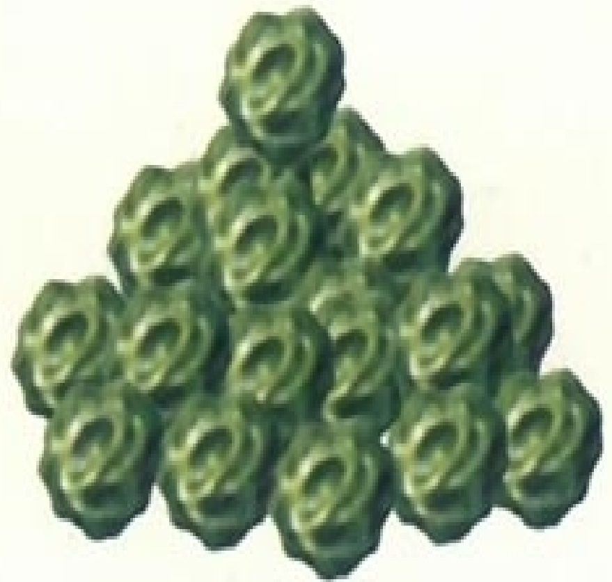
豌豆的圆粒与皱粒