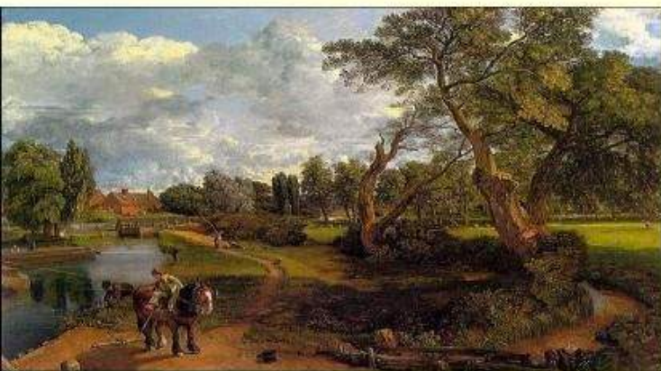
工业革命前的英国乡村小镇

“这是最好的时代，这是最坏的时代；这是智慧的时代，这是愚蠢的时代；这是信仰的时期，这是怀疑的时期；这是光明的季节，这是黑暗的季节；这是希望之春，这是失望之冬；人们面前有着各样事物，人们面前一无所有；人们正在直登天堂，人们正在直下地狱。”