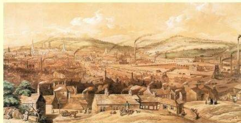
早期工业化进程中的英国乡村小镇