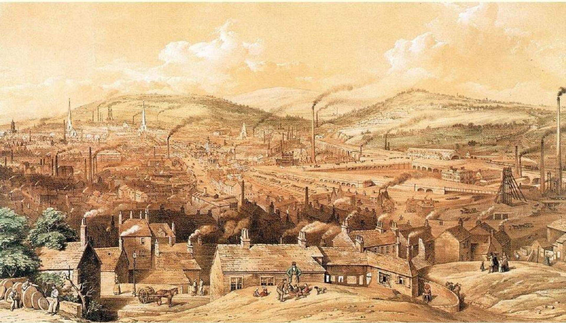
早期工业化进程中的英国乡村小镇