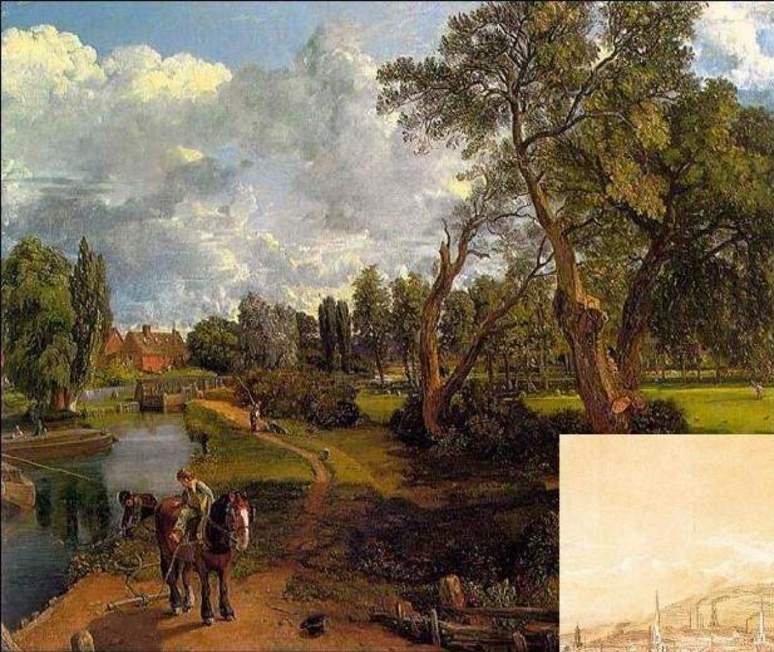
工业革命前的英国乡村小镇