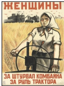
《开着联合收割机的妇女》

14. 下图是 1941—1942 年间在苏联流行的一幅宣传画。与该宣传画的政治寓意吻合的是( )