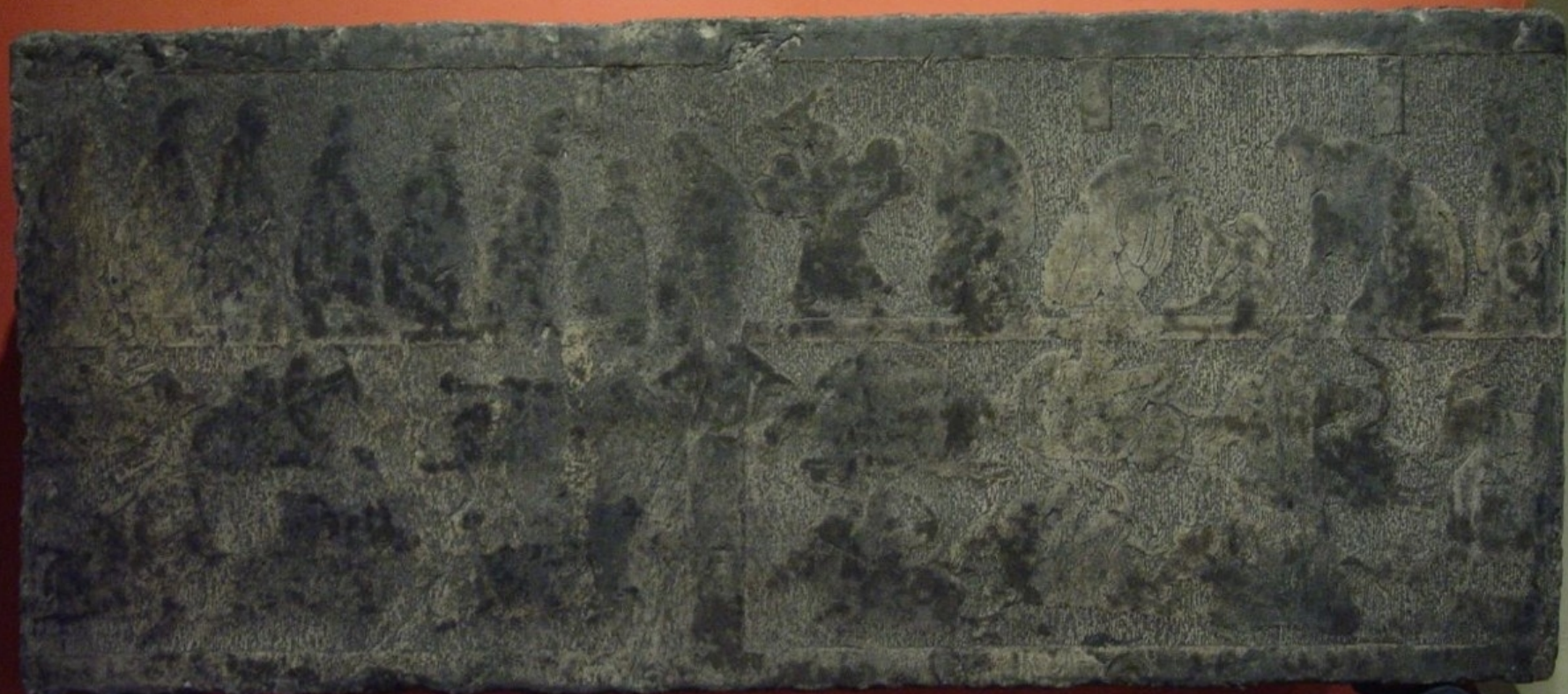
孔子见老子画像石 高 1.7米 宽 0.7米 现藏于南京博物院