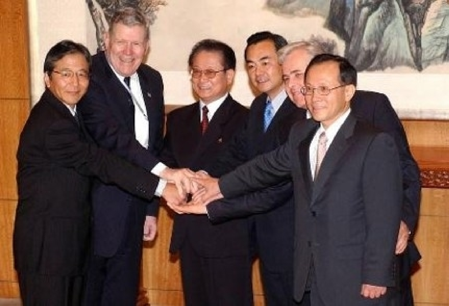
图依次为六方代表团团长日、美、朝、中、俄、韩