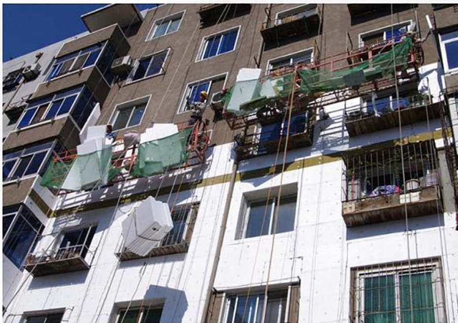
北方地区：屋顶坡度较小，墙体厚