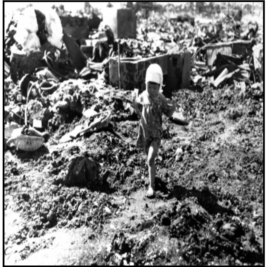
长崎, 原子弹爆炸后, 行走在废墟瓦砾间的3岁儿童。