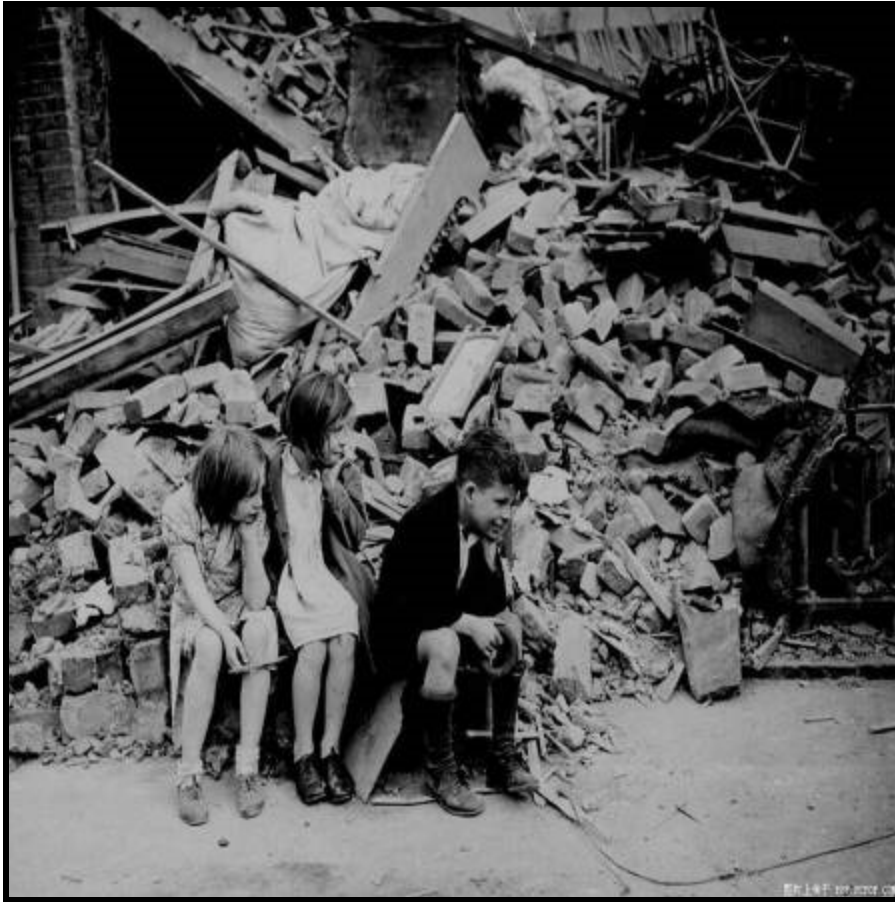
(伦敦)轰炸过后,废墟上的童年