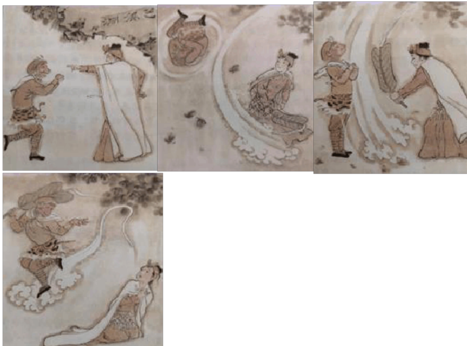
(一) (二) (三) (四)

31. 下面是《西游记》反映“一调芭蕉扇”情节的四幅画面，请你分别为四幅画面配写简洁的说明性文字。