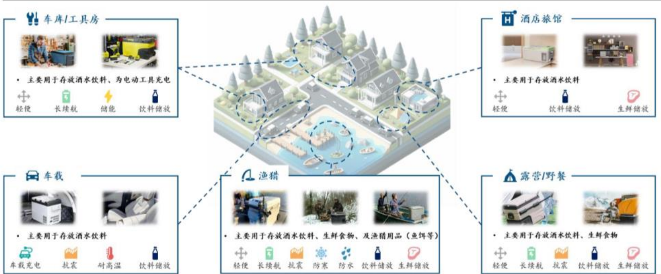
图2：便携式冰箱户外应用场景概览

在酒店中，便携式冰箱扮演着关键的角色。它们提供了额外的便利，让客人冷藏食物和饮料，或是保存当地购买的新鲜食材，还可以提供冰块。便携式冰箱改善了酒店客房的实用性，提升了客人的舒适度和满意度，已经成为中高端酒店、甚至平价酒店的常见配置。