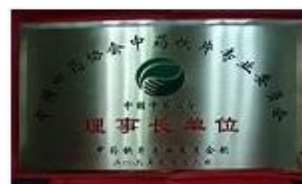
中国中药协会中药饮片专业委员会