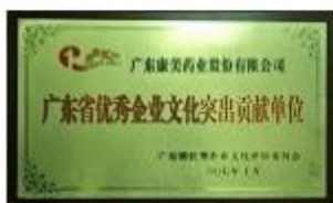
广东省优秀企业文化突出贡献单位