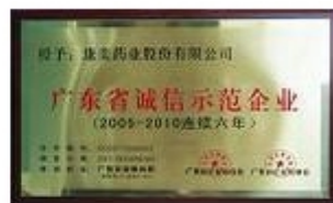
广东省诚信示范企业