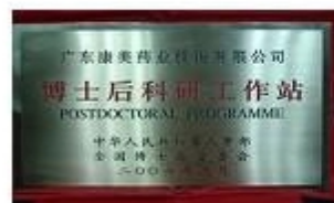
博士后科研工作站