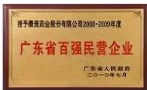
广东省百强民营企业