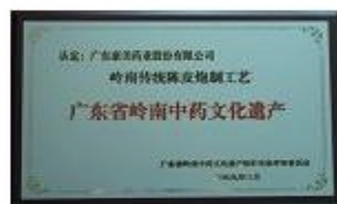
广东省岭南中药文化遗产（陈皮）牌匾