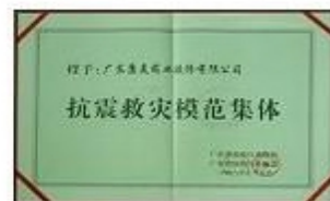
抗震救灾模范集体