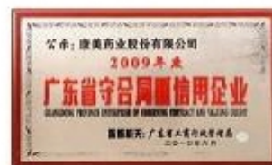
广东省守合同重信用企业