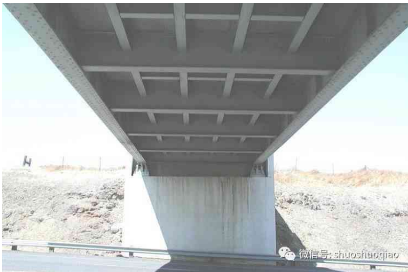
图 4 纵横梁格体系(Girder and Floor beam System)