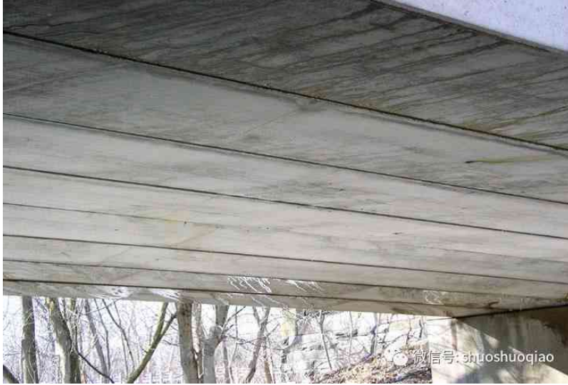
图 5 多箱梁(BoxBeam or Girders – Multiple)

使用状况包括建筑年龄、建成年份、维修年份、分离立交形式、车道数、日均交通量、日均卡车量、及支路绕道等信息。