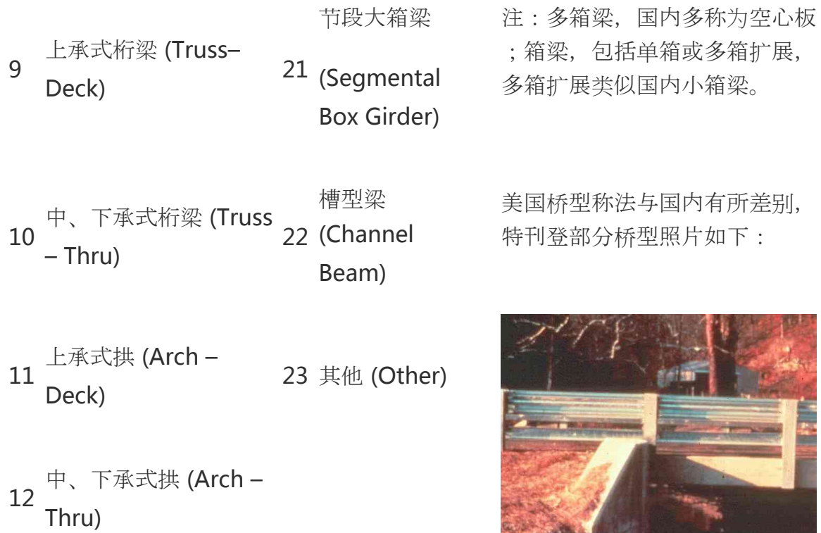
图 1 板梁(Slab)