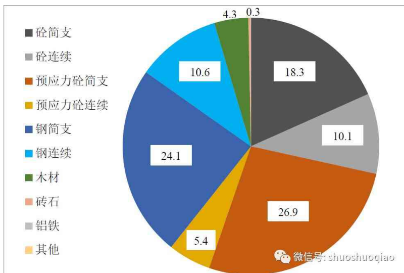
图 7 美国 2015 年桥梁材料占比图(按座数统计, 单位: %)