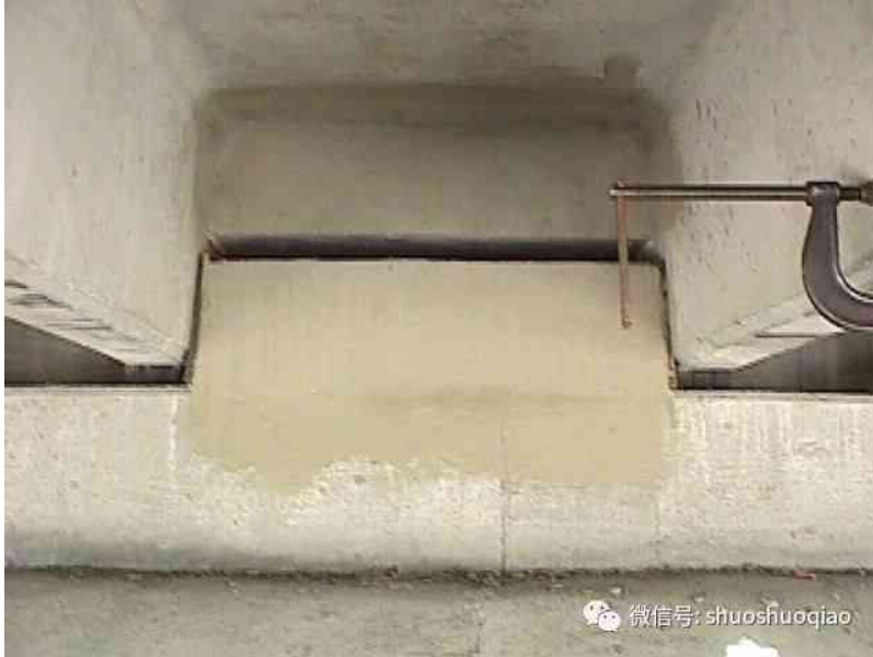
图 3 T 梁(TeeBeam)