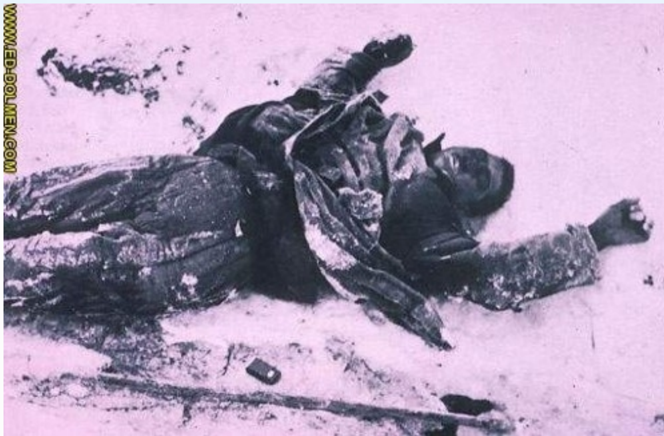
苏联红军士兵的尸体.