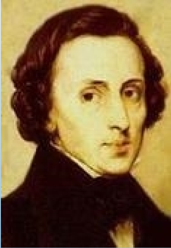
弗里德里克·弗朗索瓦·肖邦

波兰 作曲家 、 钢琴家 ，肖邦1810年3月1日生于 华沙 近郊，父亲是法国人，侨居华沙任中学法文教员，母亲是波兰人。肖邦从小就表现出非凡的艺术天赋，六岁开始学习音乐，7岁时就创作了波兰舞曲，8岁登台演出，不足20岁已出名。他是历史上最具影响力和最受欢迎的钢琴作曲家之一，是波兰音乐史上最重要的人物之一，是欧洲19世纪 浪漫主义音乐 的代表人物。肖邦一生的创作大多是 钢琴曲 ，被誉为“ 钢琴诗人 ”。