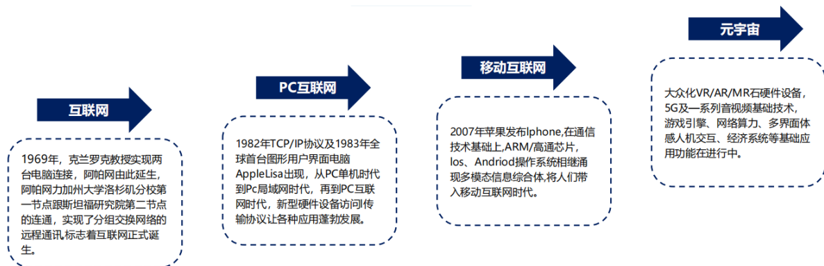
图表：元宇宙的发展历程

元宇宙 (Metaverse)：是一个与现实世界平行的线上虚拟世界，其核心在于对虚拟资产和虚拟身份的承载。