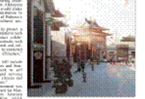
An artistic impression of the Dragon City