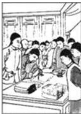
图3 武昌起义士兵占领楚望台军械库