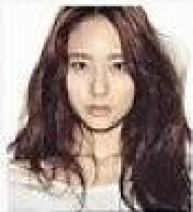
.. 크리스탈 ..