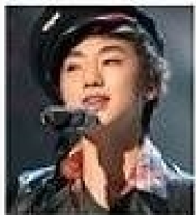
.. 가스음 ..