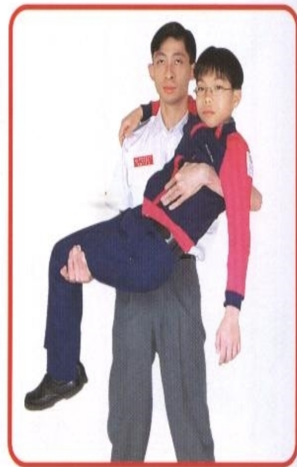
图 78 手抱法