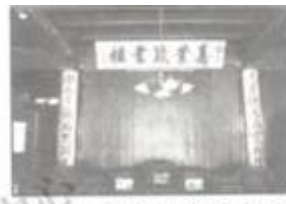
图4 南洋嘉业堂藏书楼

(1) 织里书船(图2)是穿梭于水乡河道卖书的船，始于明初全商出现的书船上可能买到的农书是( )