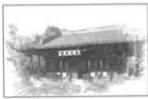
图3 湖州安定书院(想象图)