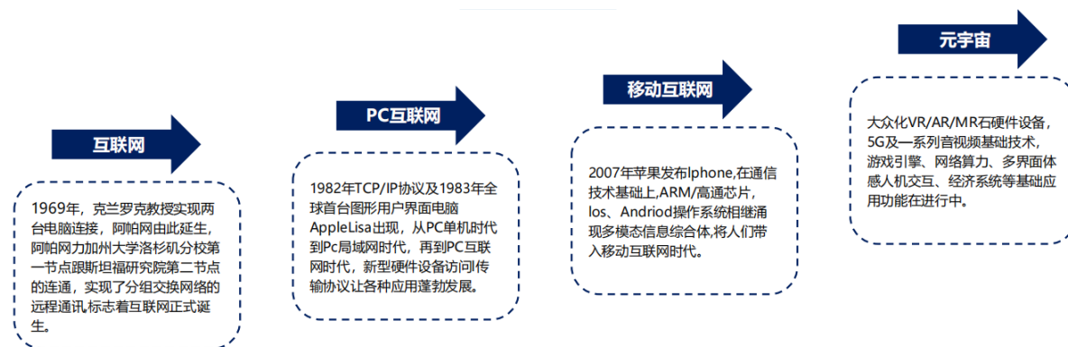
图表：元宇宙的发展历程

元宇宙 (Metaverse)：是一个与现实世界平行的线上虚拟世界，其核心在于对虚拟资产和虚拟身份的承载。