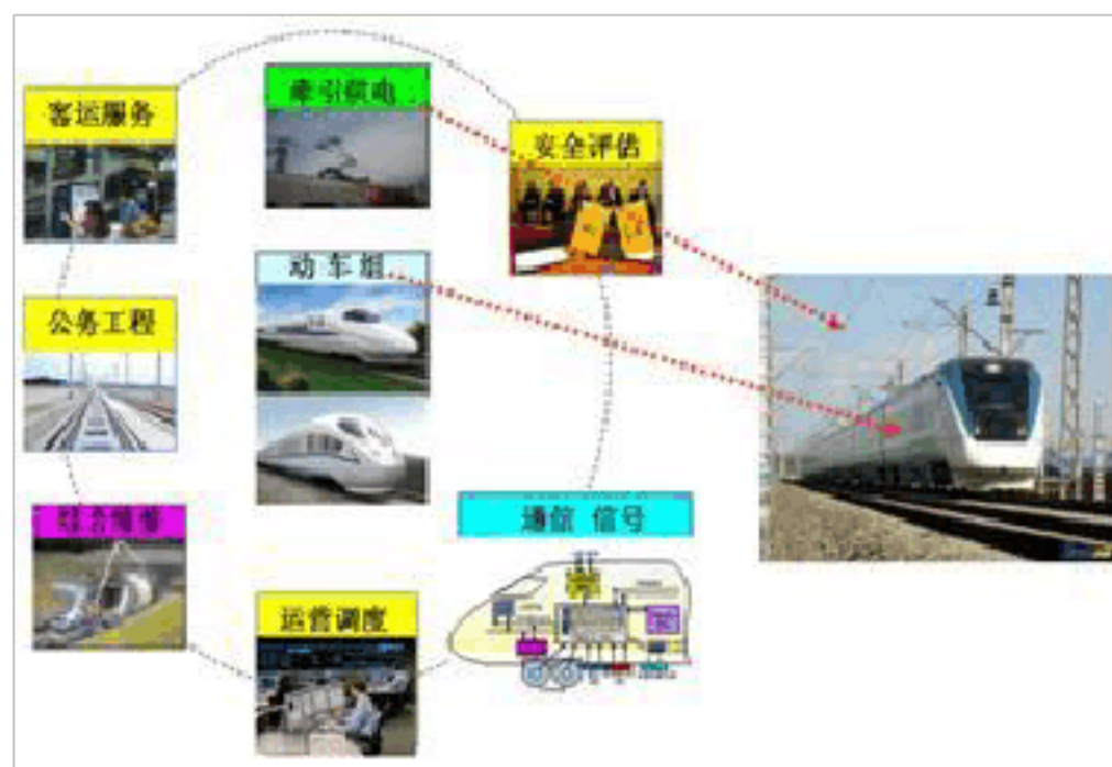
图 2-3 高速铁路方向研究领域