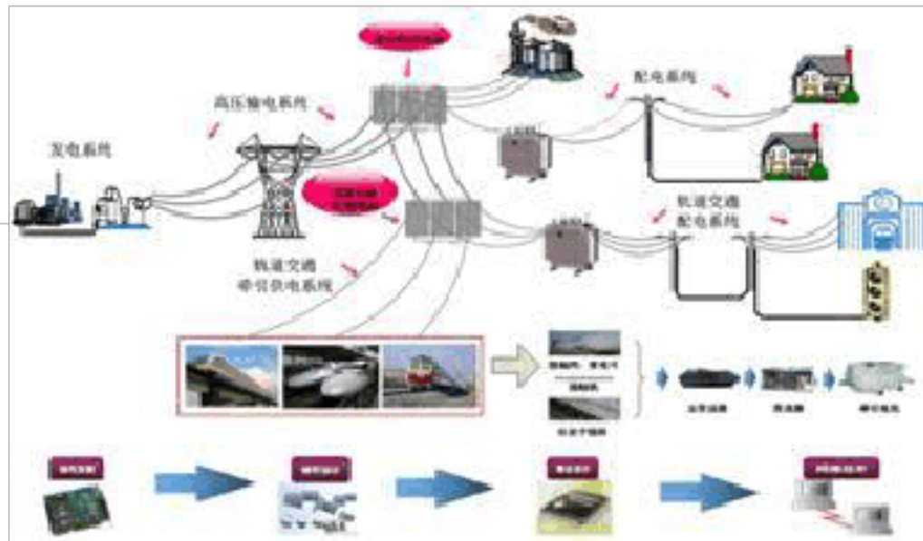
图 2-1 电气工程方向研究领域