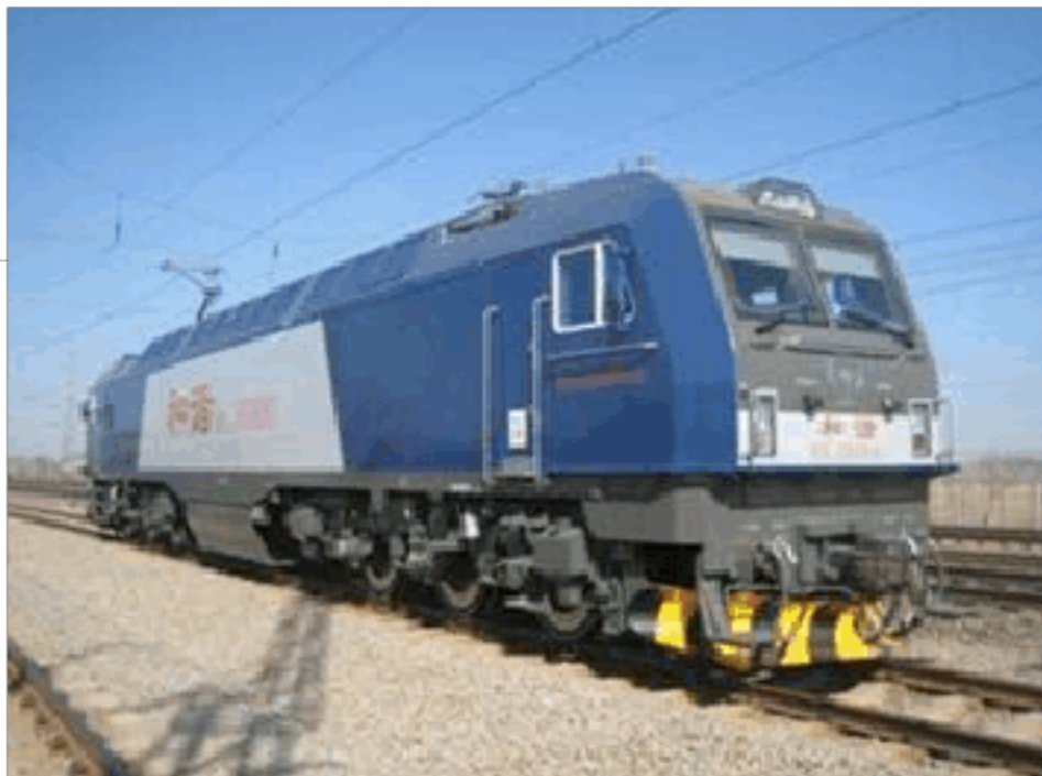
图 2-4 电力机车