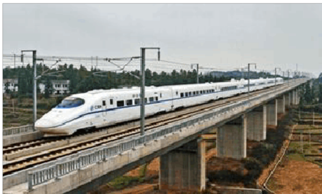
图 2-5 动车组