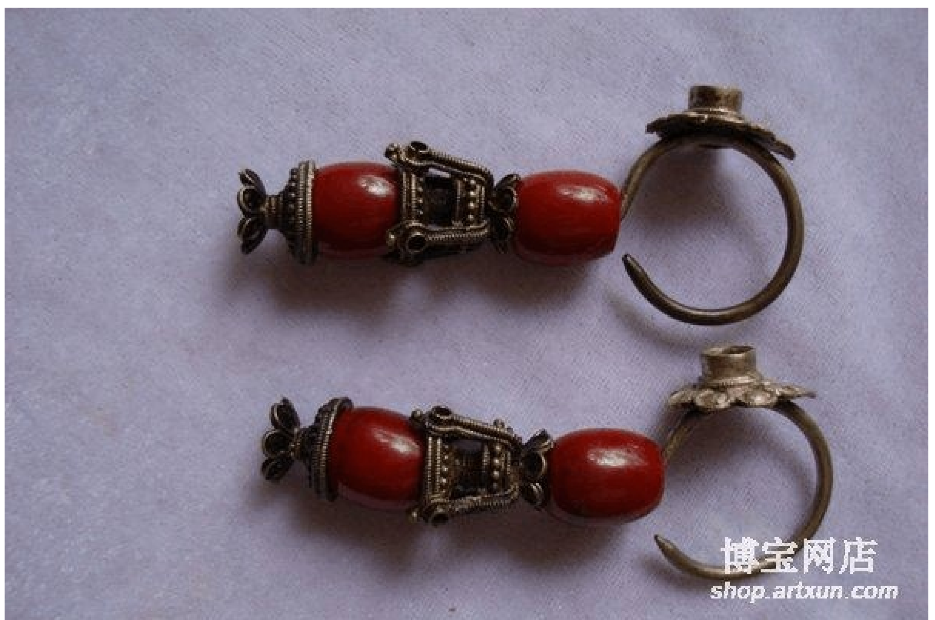
宋-明银质，镶嵌红珊瑚银耳环（8厘米）

此外，真金银落地时的跳动没有假金银来得剧烈。第四，金、银的化学性质较稳定。金在酸性液体中(如稀盐酸、硝酸等)颜色不变，而铜制品只要一触及硝酸，便会失去光泽。若是镀金，表层镀金很容易脱落，不仅脱落部分易生锈，即使镀金表面也易被铜覆盖。古代黄金中的银、铜、铁含量偏多，含银越多颜色越淡；含铜多则呈淡黄色，且稍微发绿，若入土时间偏长则会呈栗黄色；金中含铁偏多者，一般呈玫瑰红色。时下，古玩商大多依据“七青、八黄、九五赤”的口诀来识别古金器的成色。