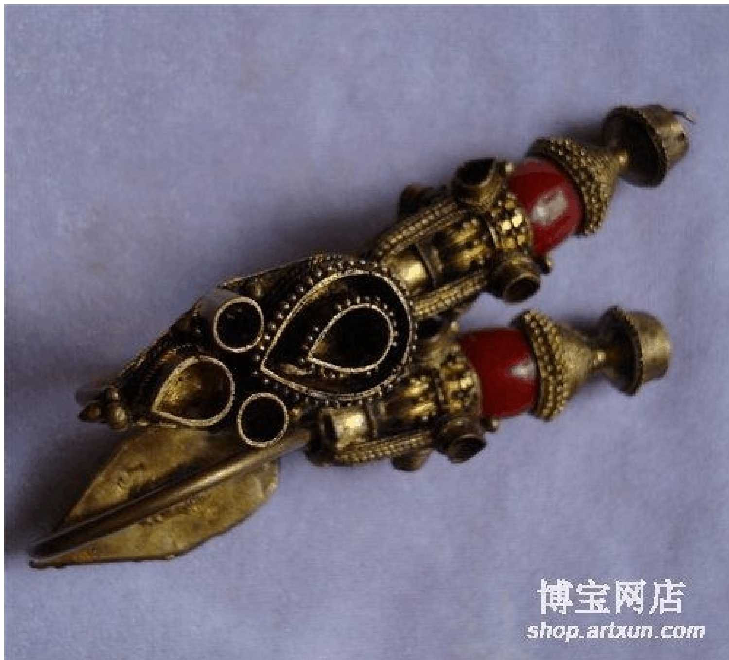
宋-明老金，镶嵌红珊瑚金耳环（10 厘米）