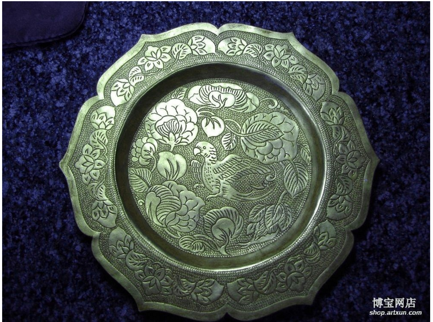
唐代。鎏金鸚鵡纹及飞鹿纹套盘