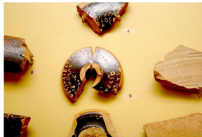
图（2）雅典民主实施陶片放逐法时的陶片

材料二《史记·秦始皇本纪》记载“天下之事无论大小皆决于皇上，国家政事，不论大小，都由皇帝决定”。那时的奏章都是刻在竹简上的，据说秦始皇每天看下面送来的奏章，要看一百二十斤，不看完不休息。