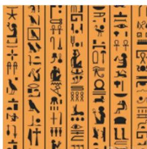
图二 象形文字（纸草文字）