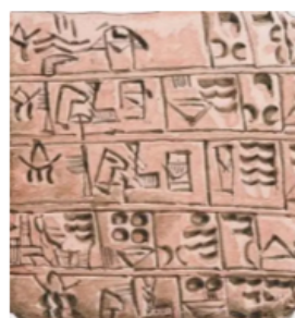
图三 楔形文字（泥板文字）

材料二：中国文字是由刻画符号逐渐演变而来的，商代的甲骨文构成和方法有象形、指事、会意、形声。古埃及的象形文字最初仅是一种图画文字，后来发展成象形文字，由表意、表音和部首三种符号组成。楔形文字是两河流域的苏美尔人首创的，最初这种文字是图画文字，后逐渐发展成表意文字。