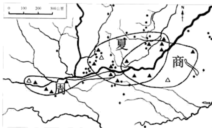
图例△▲都城●铜矿产地◆锡矿产地

15. 历史地图可以培养学生的时空观念，观察下面示意图，可以得出的结论是夏、商、周时期（ ）