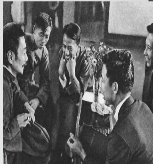
1936年在全国木刻展览会上和青年在一起。