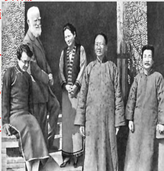
1933年在上海和宋庆龄蔡元培在一起。