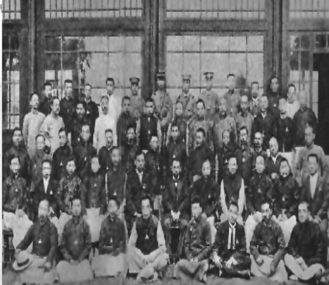
1914年在北京与全国儿童展览会会员合影。