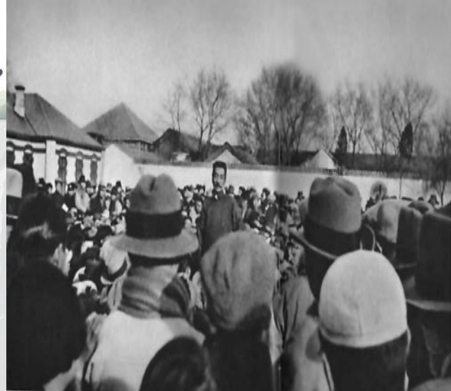
1932年在北京师范大学演讲。