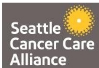
西雅图癌症治疗联盟