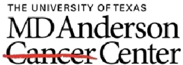
美国安德森癌症研究中心