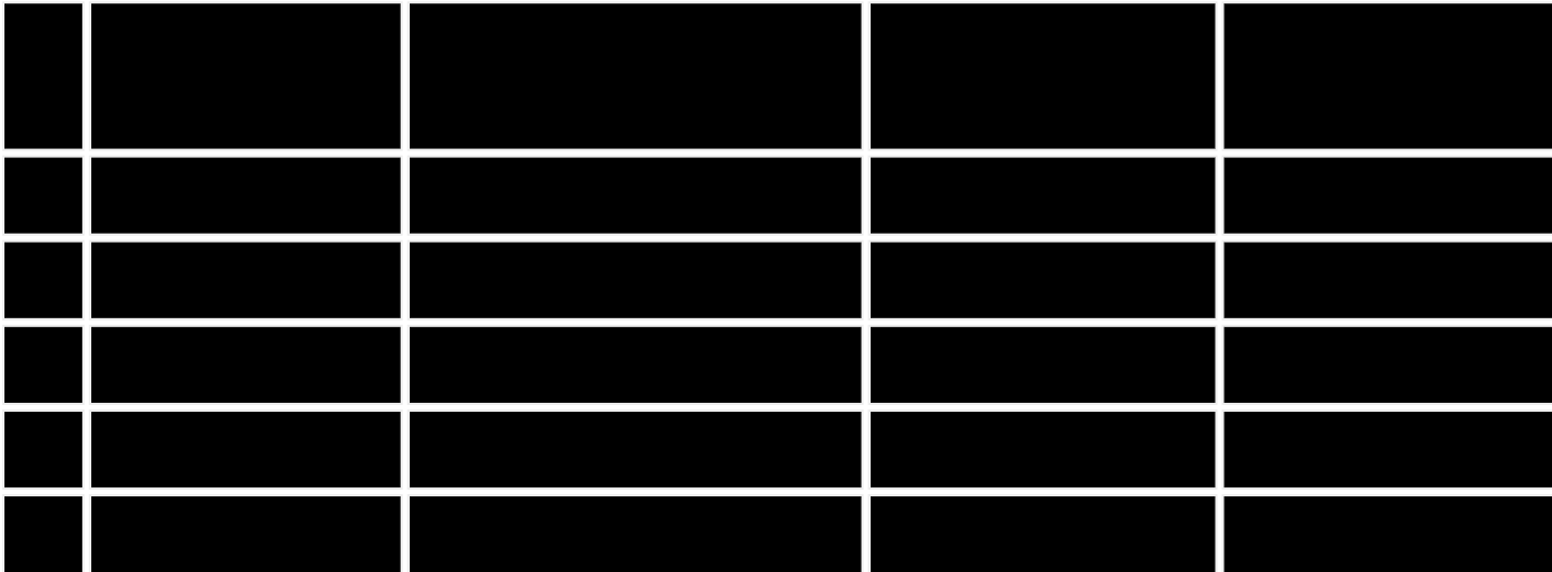
图3 全国各行业增加值表格