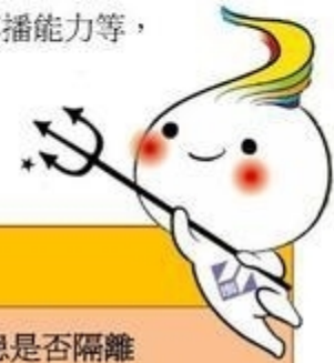
國內法定傳染病 5 分類

《傳染病防治法》根據傳染病嚴重程度、致死率、傳播能力等，將依傳染病區分為 5 類：