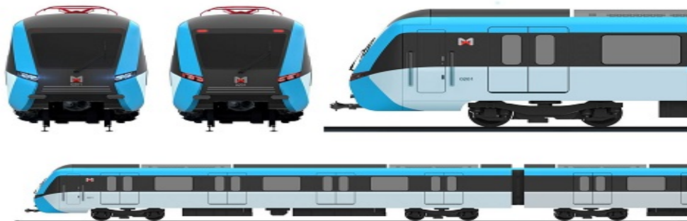
图 1.1 车辆编组形式

宁波地铁使用南车株洲电力机车有限公司设计的 B 型地铁列车，采用—A=B*C=C*B=A—六节编组的列车编组形式如图 1.1 所示。