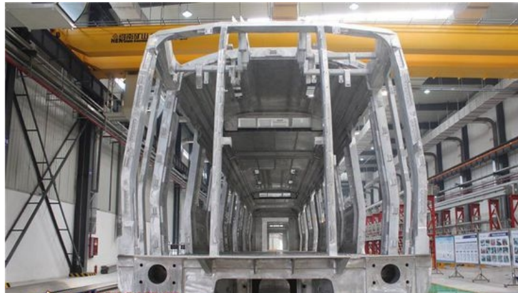
图 1.2 钢制车体整体承载结构

(1) 车体 分有驾驶室车体和无驾驶室车体两种。车体是容纳乘客和驾驶员(对于有驾驶室的车辆)的地方，又是安装与连接其他设备和部件的基础。近代城市轨道交通车辆车体均采用整体承载的钢结构或轻金属结构,以达到在最轻的自重下满足强度的要求。一般均有底架、端墙、侧墙及车顶等如图 2.2 所示。