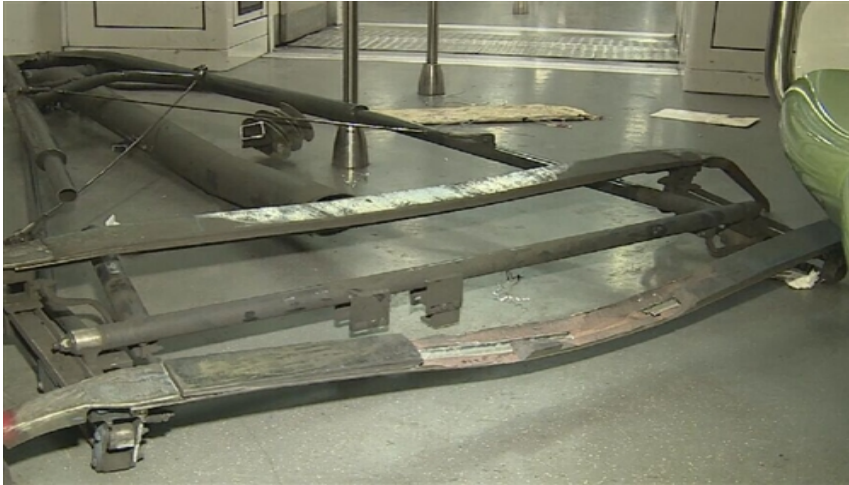
图 1.4 受电弓碳板受损

(3) 受电弓无法正常升起 受电弓无法正常升起的原因有多种，也可以分为几个不同的情况。如果蓄电池的电压大于车辆的负载工作的最低电压，这就会造成受电弓升起时的电压大于主风管的压力，这种情况下，可以采用脚踏受升弓的方式进行升弓；如果蓄电池的电压无法满足车辆的负载工作，但是主风管的压力大于受电弓升起的压力，则需要进行控制柜中的升弓气阀，促使受电弓与接触网接触，此时充电机可以紧急启动，经过一段时间可以提供足够的电压促使受电弓正常升起；如果蓄电池电压无法满足车辆的负载要求，同时主风管的压力小于受电弓升起的压力，这就需要首先利用脚踏升弓的方式进行升弓，直到压力可以达到受电弓升起的压力，此时再启动充电机，促进受电弓的正常升起。如果排除了以上三种情况，受电弓仍然无法正常升起，则需要考虑是否是电路出现问题，同时也要对电气原理以及车辆线路表进行排查。