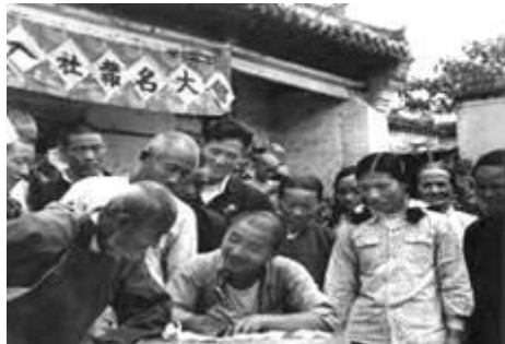
农民申请加入生产合作社

19. 图片能真实反映一定时期的历史现象，下图反映的历史事件对中国产生过很大影响，其相同之处是