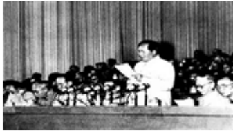
毛泽东在中共八大上讲话

(4) 1956年9月，中共八大在北京召开。中共八大在探索我国建设社会主义道路方面取得了什么成果？