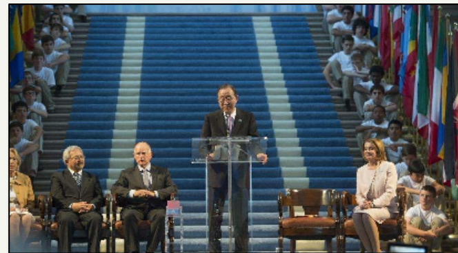
2015年6月，联合国举行《联合国宪章》签署70周年纪念活动

1945年4—6月，在第二次世界大战即将结束之际，来自50个国家的代表共聚美国旧金山，决定建立一个组织以捍卫世界和平，建设一个更加美好的世界。本次会议堪称有史以来最盛大的一次国际会议，参会代表共有850人，加上他们的顾问、工作人员以及会议秘书处人员，总人数达到了3500人。此外，还有2500多名新闻界代表及社会团体的观察员。在经历了数百次大大小小的会议之后，各国代表签署了《联合国宪章》和《国际法院规约》。