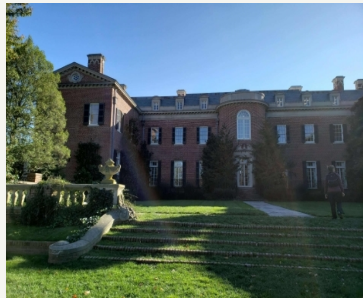
《联合国宪章》诞生地——敦巴顿橡树园

1943年，中、美、苏、英等国经过莫斯科会议和德黑兰会议的讨论后，就联合国的一些基本想法达成一致。但是，联合国的具体机构应如何安排，仍然悬而未决。1944年10月，四国代表在美国敦巴顿橡树园召开会议，就联合国的组织架构进行讨论。他们提议，联合国由4个主要机构组成：大会，安全理事会，国际法庭，秘书处。“大会”由所有会员国组成（下设“经济及社会理事会”）；“安全理事会”由11个会员国组成，其中5个为常任理事国。但是，此次会议未能就安全理事会表决程序这一至关重要的问题达成一致。