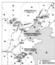
图二：三大战役示意图