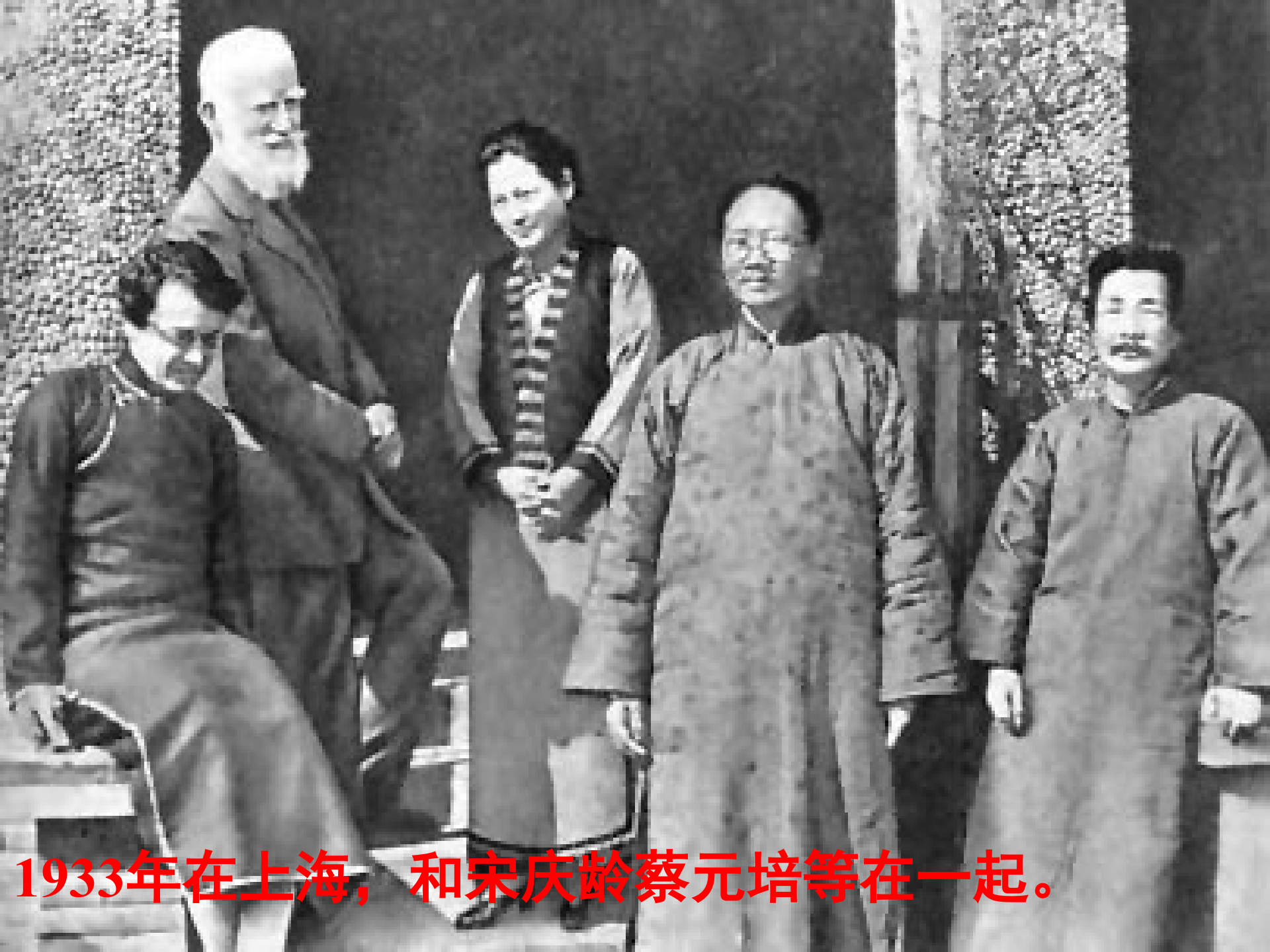
1933年在上海，和宋庆龄蔡元培等在一起。