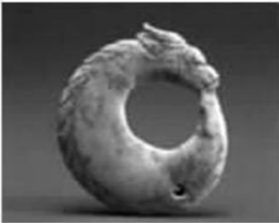
凌家滩文化玉龙图