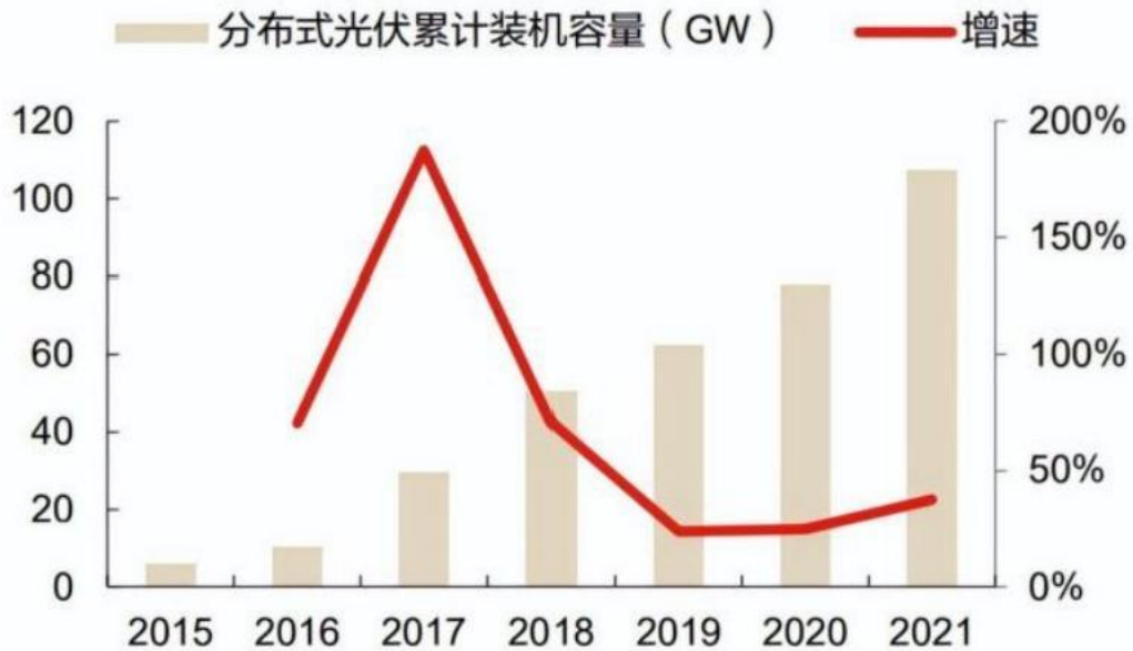
图 13: 2015-2021 年中国分布式光伏累计装机容量及增速