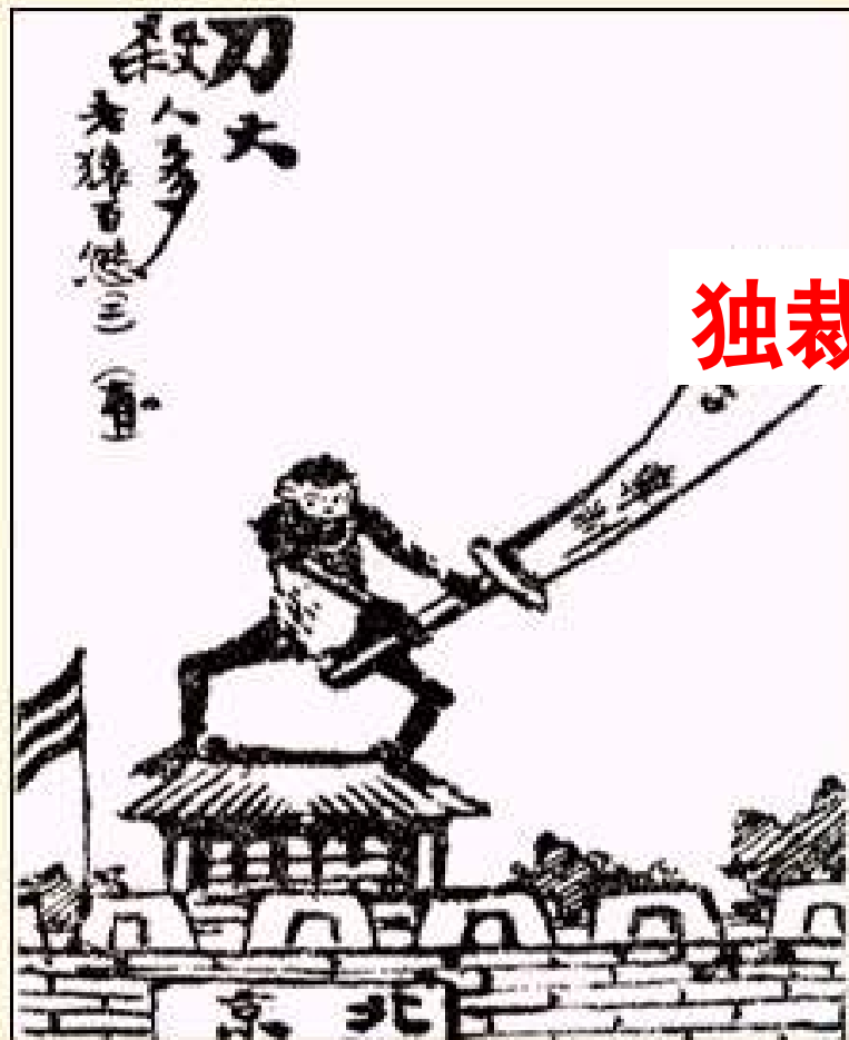
袁世凯走上专制旧路。这是当时人创作的漫画。 选自钱病鹤编《袁政府画史》。