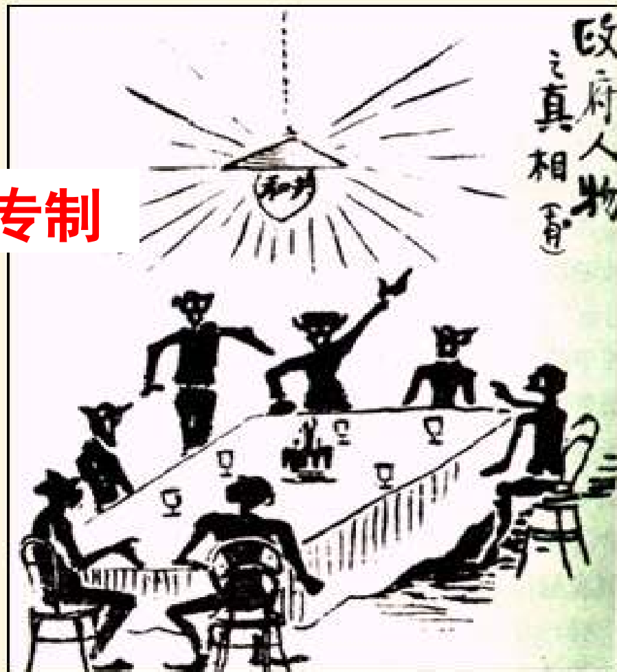
《政府人物之真相》是当时人创作的讽刺漫画， 表示政府虽有“共和”之名，实际是猿（袁）家天下。