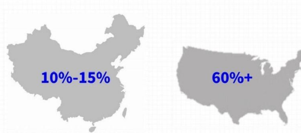
中美预制菜行业渗透率对比