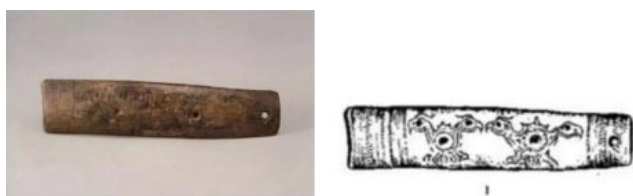
图 4.3 左\双头对鸟骨匕首 右\双头对鸟骨匕线稿

关于对鸟纹的具体定义与明确说法到目前为止没有详细的资料记载。田自秉先生在《染织纹样史》中涉及到的原始时代的“双鸟纹骨匕”（如图 4.3）、秦代的“树纹对鸟纹锦”、唐代的“对雉鸟纹织锦”、清代的“对凤纹盘”等文物品名，也大致是以两只鸟、或是两只具体品种鸟为主要纹样的模糊称谓 ① 。本文的“对鸟纹”属于祥瑞范畴，是祥瑞对鸟纹。