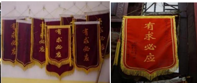
图 2.5 锦旗