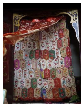
图 2.8 周氏祖堂内的百花帐