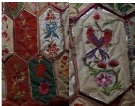
图 4.4 百花帐对鸟纹

与自然图案进行组合构图，这无不与当地百姓“驱灾辟邪”意愿相符合。“对鸟纹”更是表现了瑞昌百姓对天地生灵的敬畏以及对美好愿望的祈求。