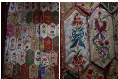
图 3.3 左\周氏祖堂内的百花帐 右\对鸟纹